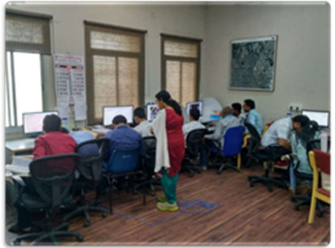
Verification of Cadastral Maps by Patwari at GIS Lab